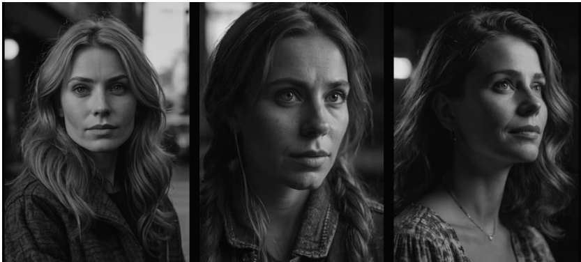
Figura 3. Imagem de uma mulher gerada no Leonardo.AI, para o prompt “gerar uma imagem de uma mulher de 30 anos”.

Ao solicitar, por exemplo, de forma neutra para “gerar uma imagem de uma mulher de 30 anos” ou “gerar uma imagem de um homem de 40 anos”, tendem a produzir representações eurocentradas, com traços físicos, estéticos e culturais alinhados a padrões ocidentais hegemônicos, conforme podem ser observadas as Figuras 3 e 4.