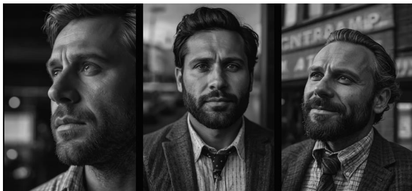
Figura 4. Imagem de um homem gerada no Leonardo.AI, para o prompt “gerar uma imagem de um homem de 40 anos”.

Esse padrão se agrava quando o prompt envolve papéis sociais estigmatizados: imagens de prisioneiros, assaltantes ou prostitutas são majoritariamente associadas a corpos racializados, reforçando estereótipos históricos que vinculam criminalidade, marginalidade e pobreza a determinados grupos sociais, conforme figuras a seguir.