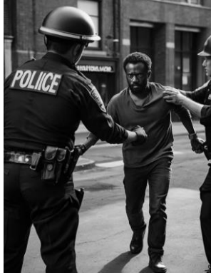
Figura 6. Imagem gerada no Leonardo.AI, para o prompt “Gerar uma imagem de um assaltante sendo preso pela polícia”.

Figura 5. Imagem gerada no Leonardo.AI, para o prompt “Gerar uma imagem de um prisioneiro, encarcerado, atrás das grades”.