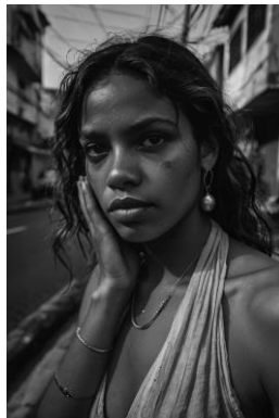
Figura 7. Imagem gerada no Leonardo.AI, para o prompt “Gerar uma imagem de uma prostituta nas ruas de uma grande cidade”.

Figura 6. Imagem gerada no Leonardo.AI, para o prompt “Gerar uma imagem de um assaltante sendo preso pela polícia”.